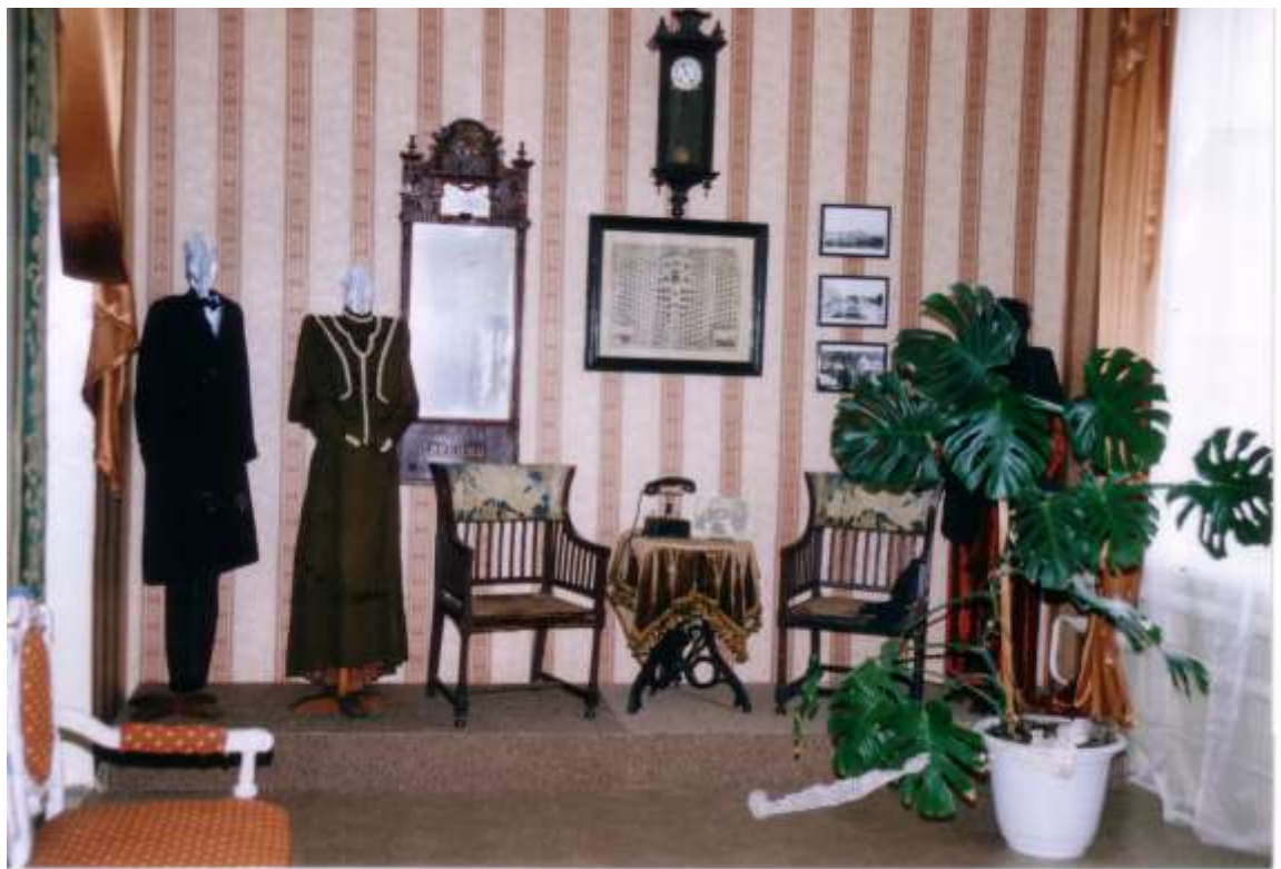
Фото 16. Музейная экспозиция с вещами помещиков Балиных.