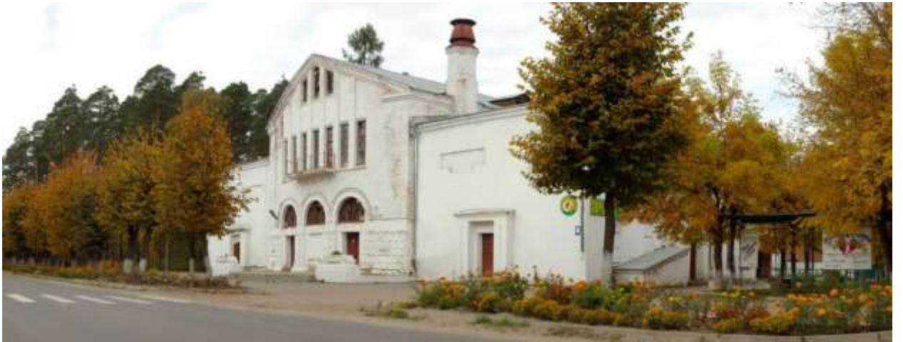
Фото 9. Народный Дом 2005 год