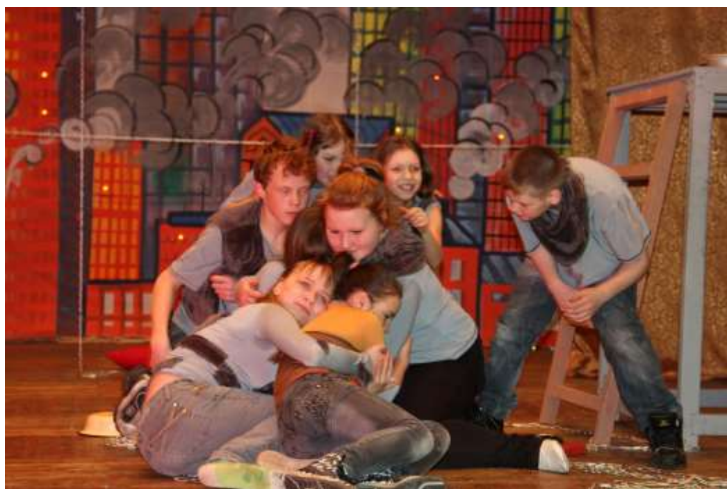
Фото 22. «Клетка» Л.Корсунский, реж. Е.Артемьева, 2012 г.