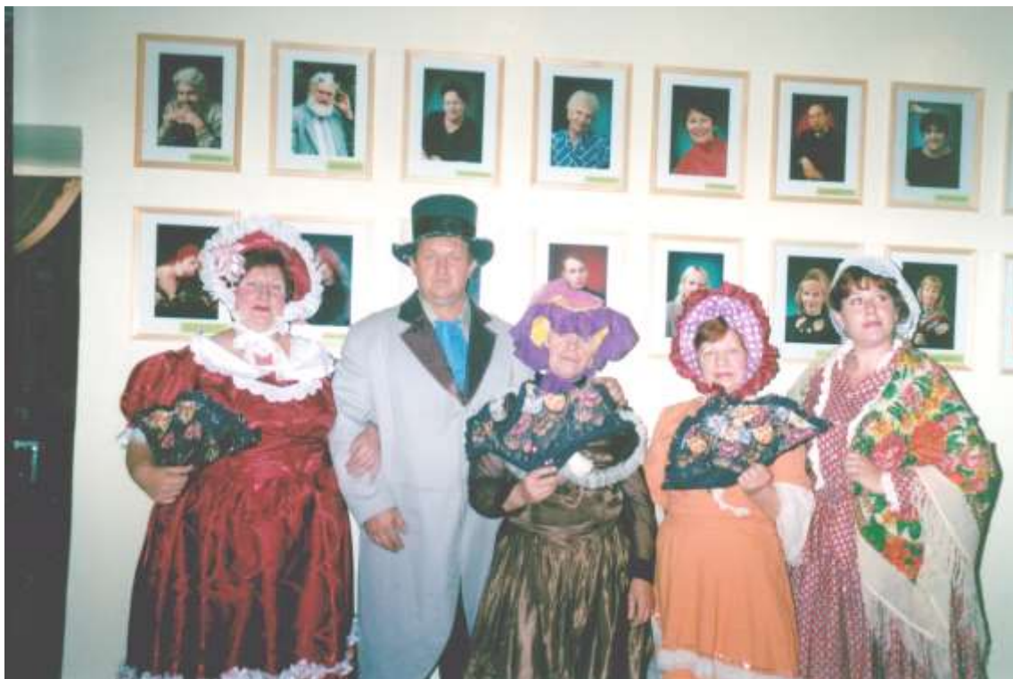
Фото 21. Участники районного театрального фестиваля «Шаг в небо» на открытии музея театра, 2004 год.