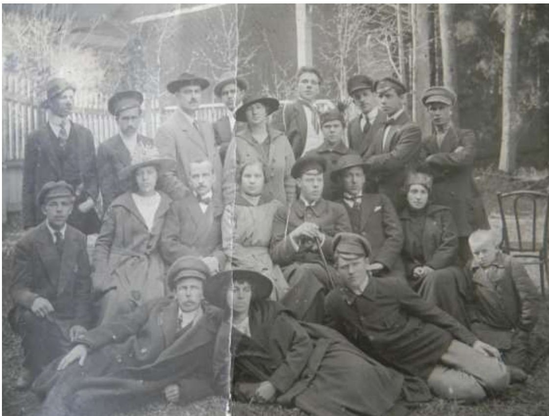
Фото 5. Труппа театра 1920 е.