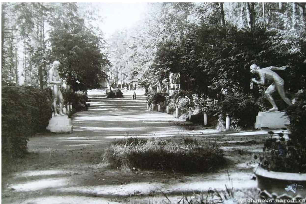
Фото 8. Парковая аллея у Народного дома