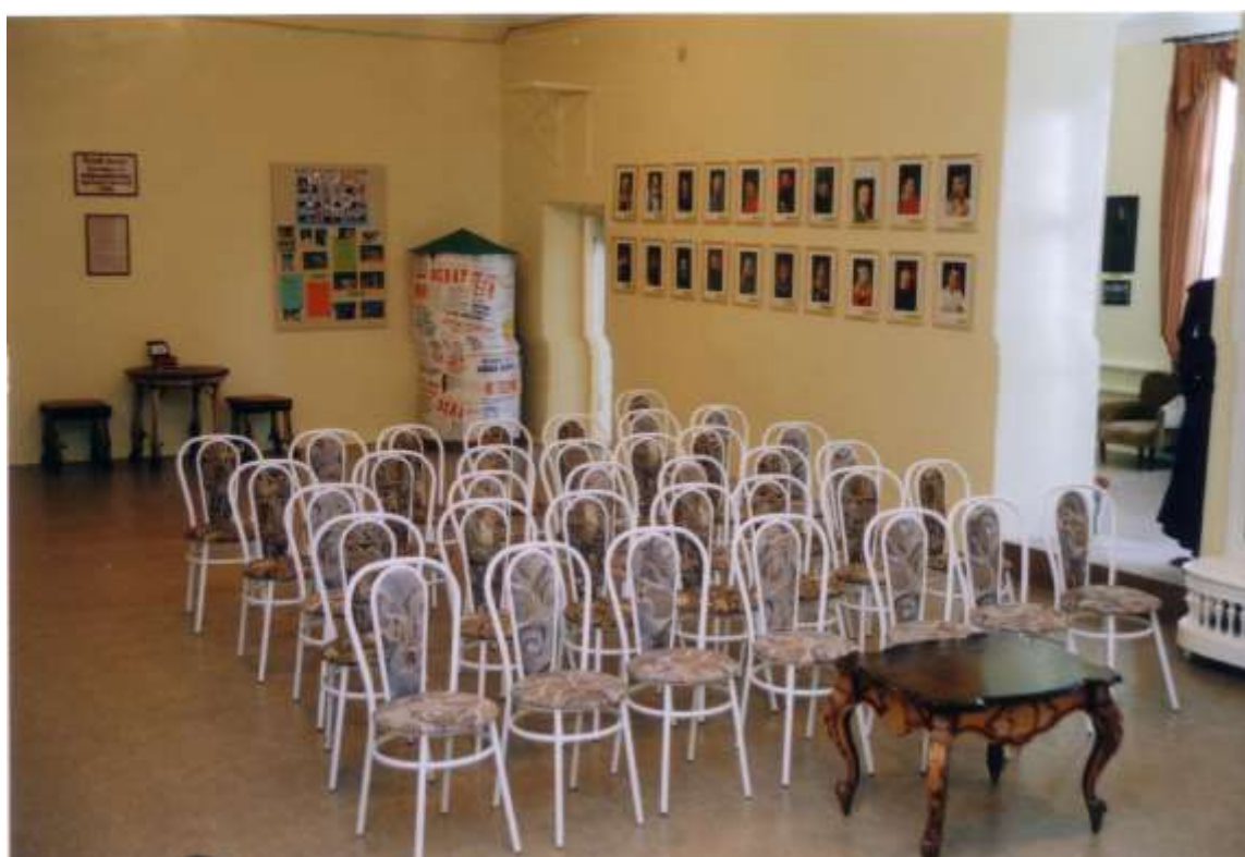
Фото 20. Малый театральный зал