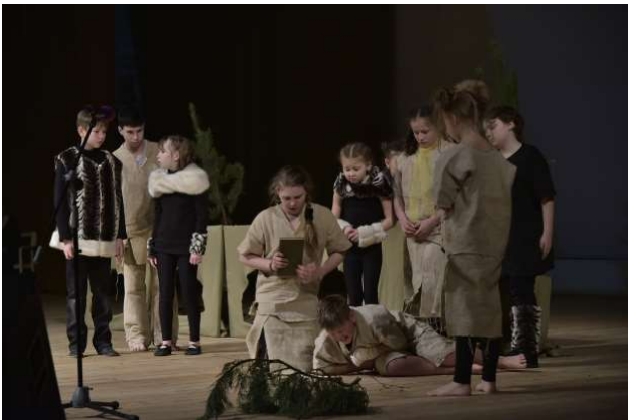
Фото 24. «Сердце чистой породы» по произведению К. Сергиенко «До свидания овраг!», реж. Е.Артемяева, 2018 г.