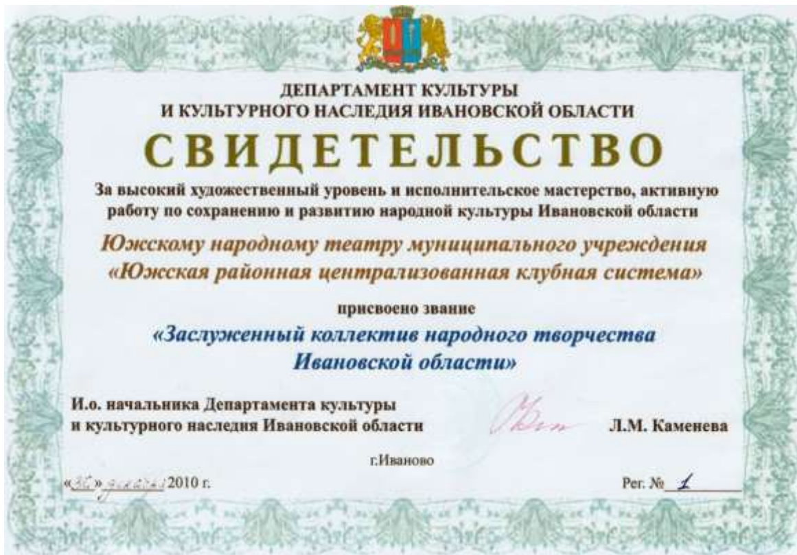
Фото 27. Свидетельство о присвоении Южскому народному театру звания «Заслуженный коллектив народного творчества Ивановской области»