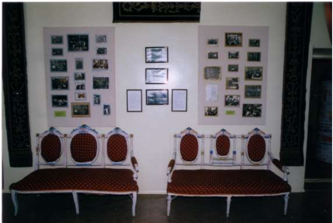
Фото 18. Декорации к спектаклям 1960-х годов