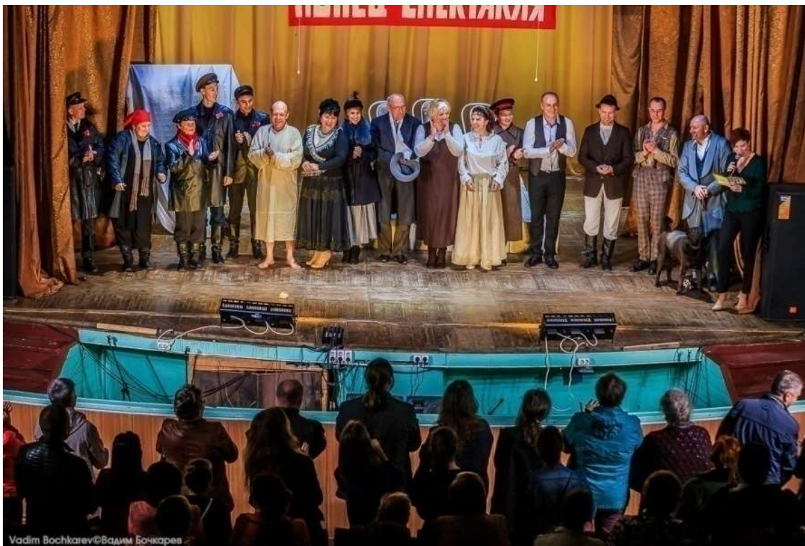
Фото 25. «Собаچه сердце» по произведению М. Булгакова, 2018 г.