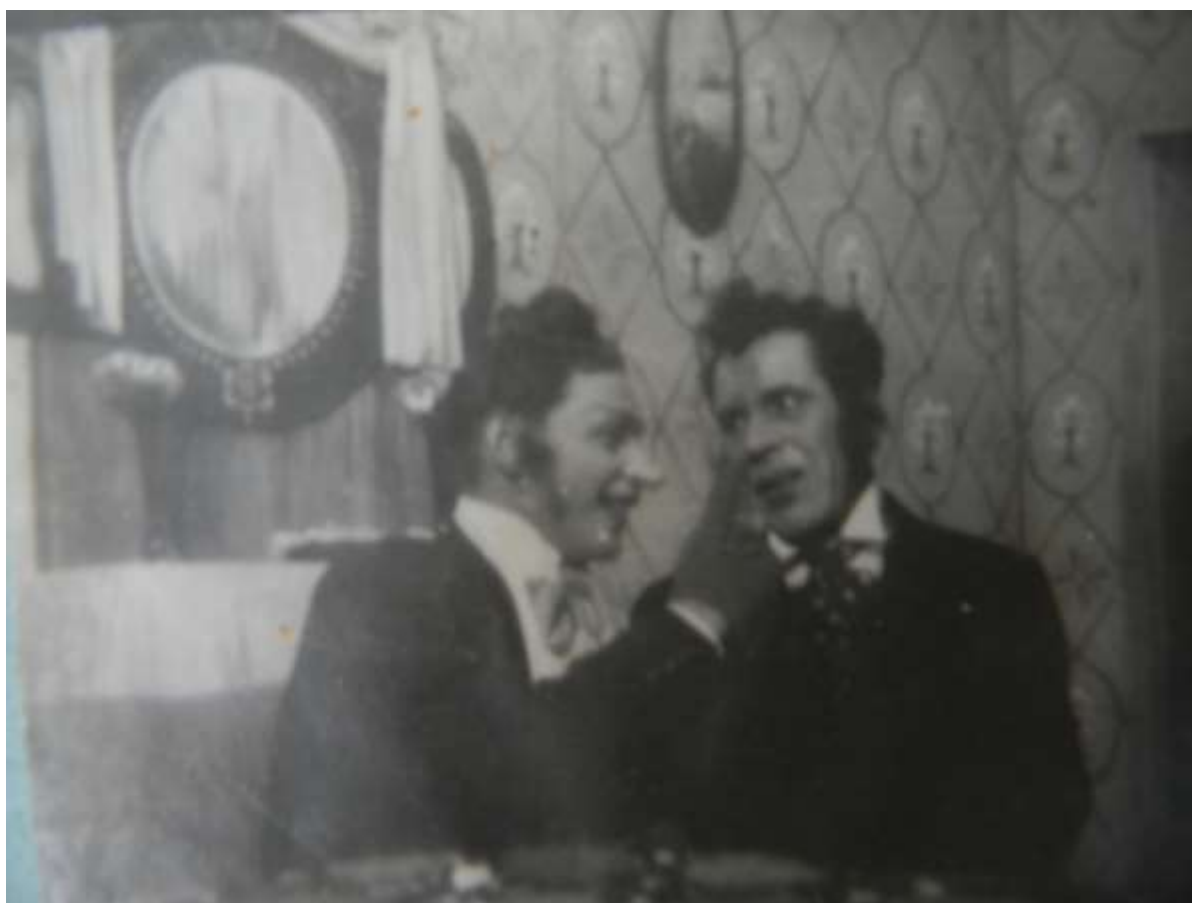
Фото 12. Н.В.Гоголь «Свадьба», реж. Оборенко 1949 г.