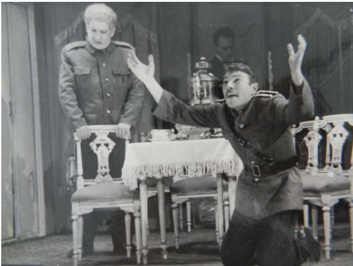
Фото 14. Огненный мост Б.Ромашов, реж. В.И. Ершов, 1969 г.