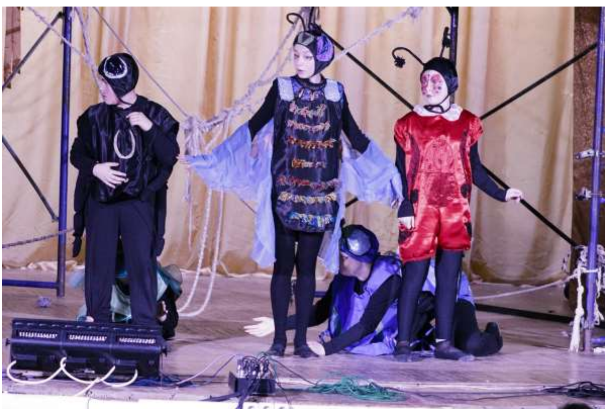
Фото 26. «Мечтай» по мотивам сказки А. Донатовой «Паушок Лёттик и большая птица», реж. Е.Артемяева, 2019 г.