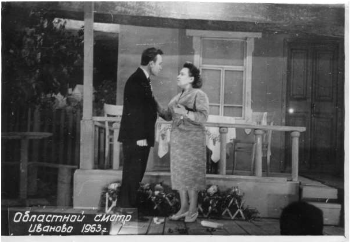
Фото 13. Областной смотр, Иваново, 1963 г.