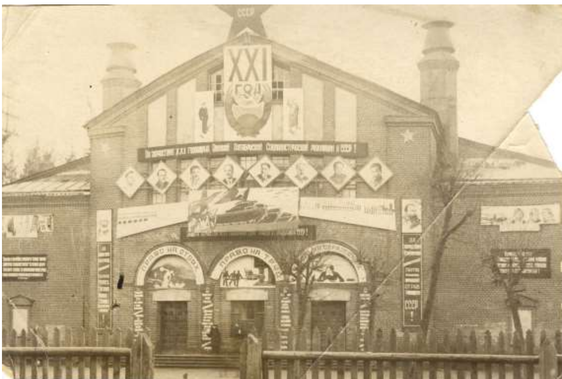
Фото 6. Народный дом украшен к празднику «Великого октября»