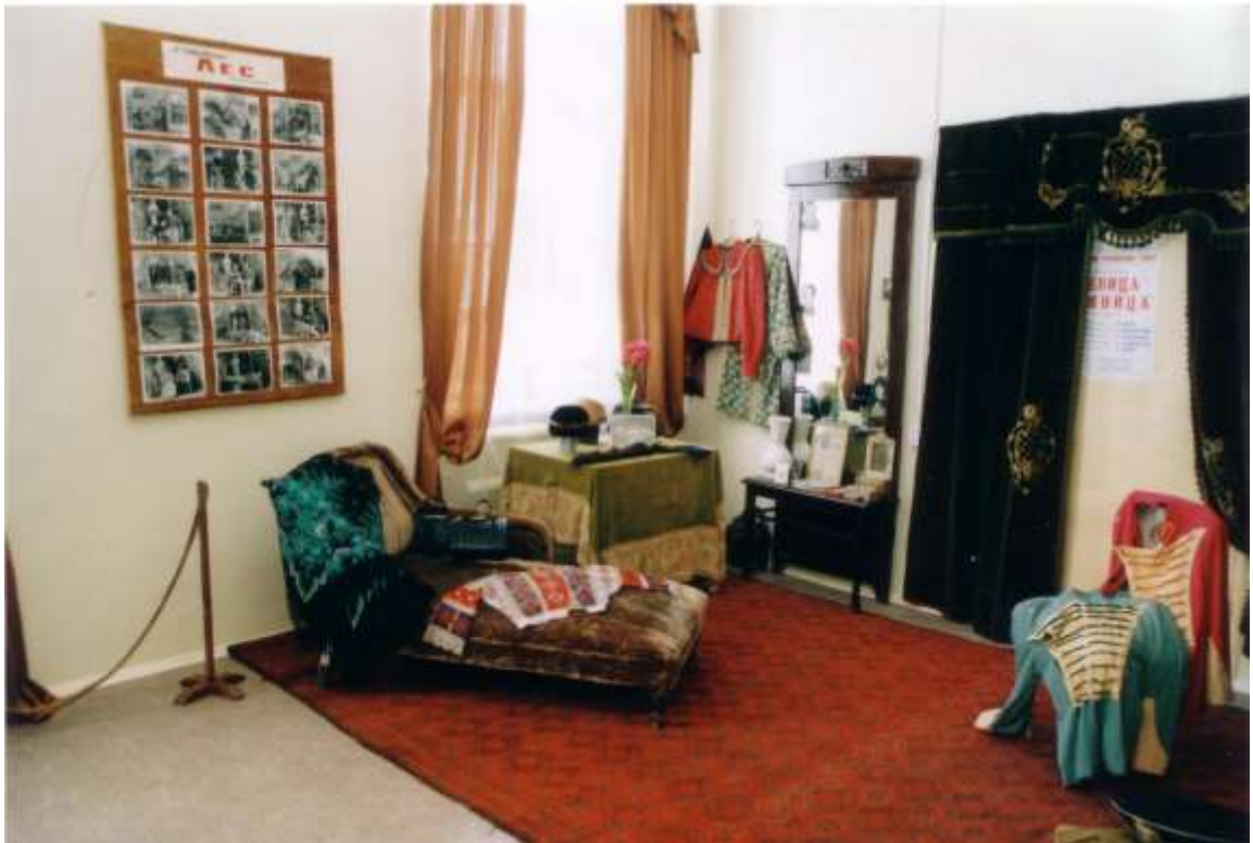
Фото 17. Сохранившиеся декорации к спектаклю «Лес»