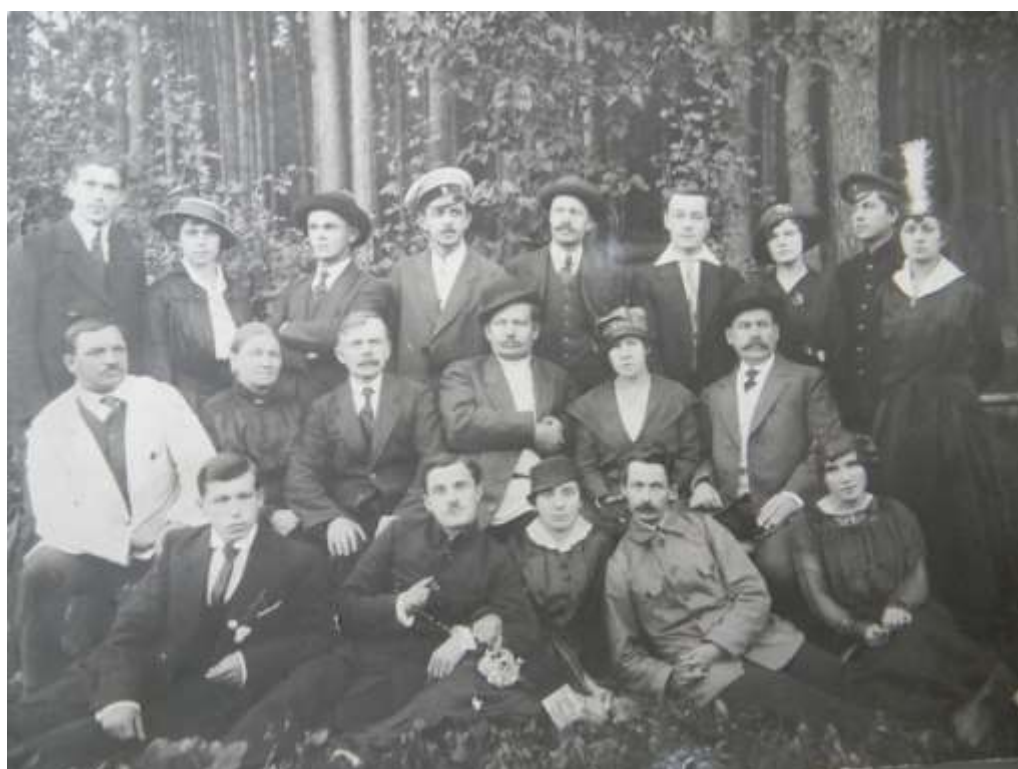
Фото2. Клуб любителей драматического искусства при Товариществе мануфактуры А.Я. Балина 1890е-1910-е г.г.