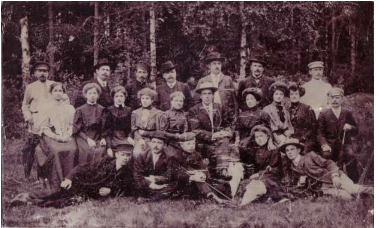
Фото 4. Коллектив театра 1905 года