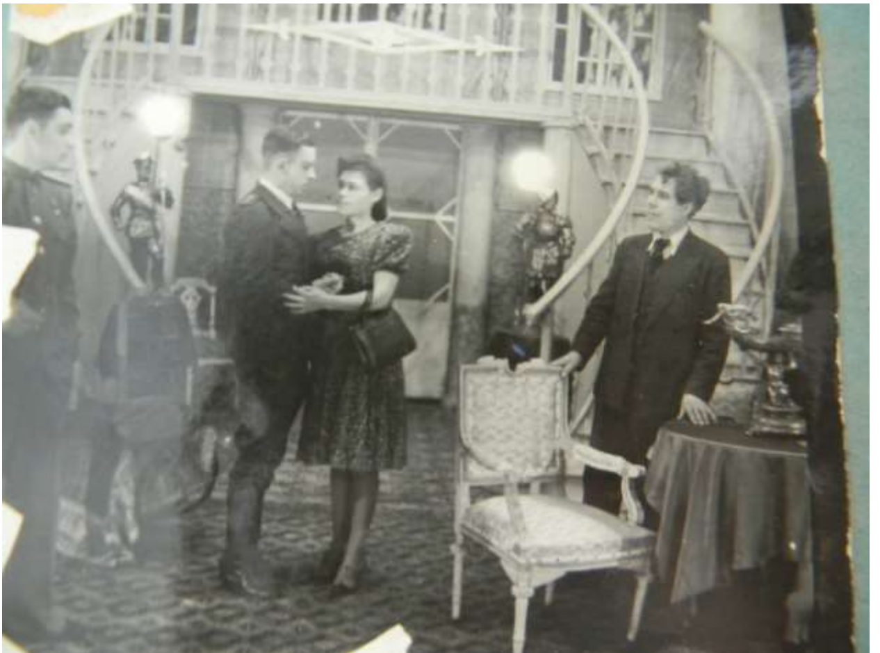
Фото 10. К. Симанов «Под каштанами Праги», реж. Н.Пестов, 1944г.