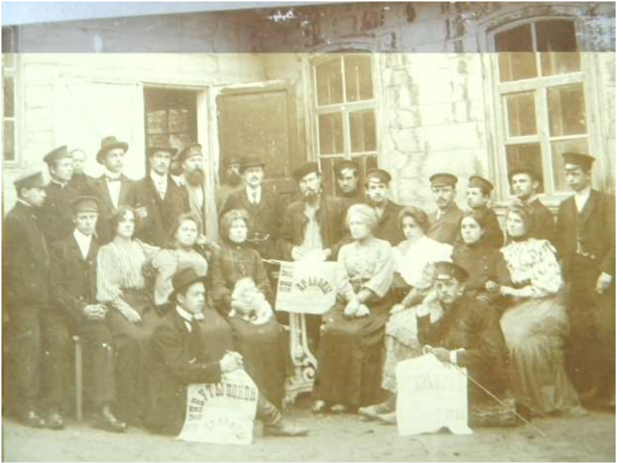
Фото 3. Труппа театра у конторы фабрики после спектакля «Драконы»