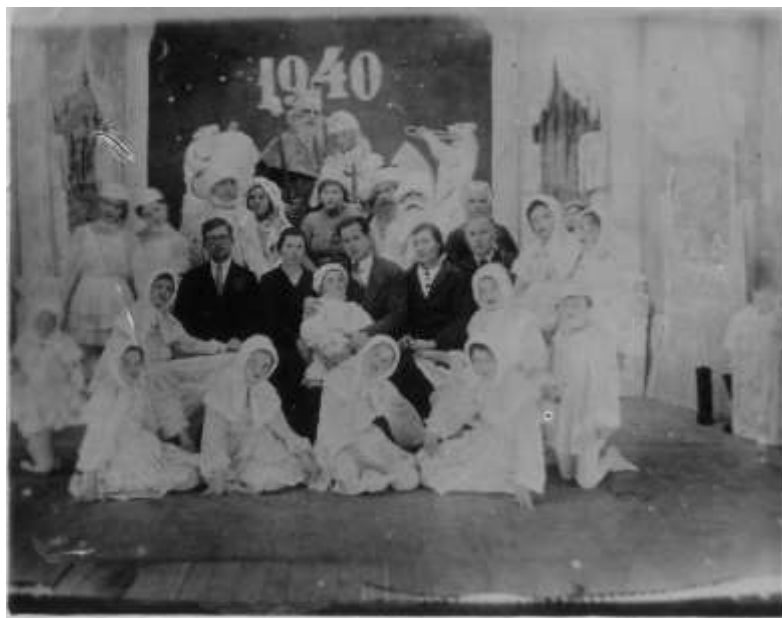
Фото 11. Новогодний спектакль, 1940 г.