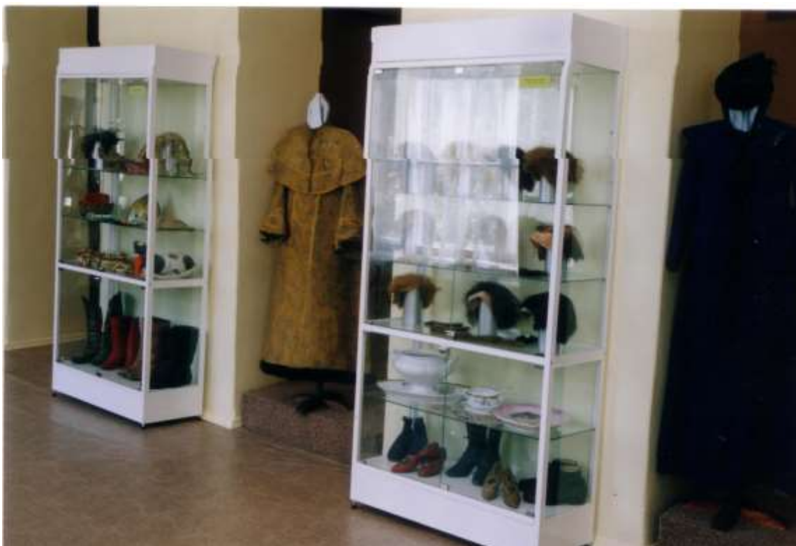
Фото 19. Коллекция старинных театральных париков